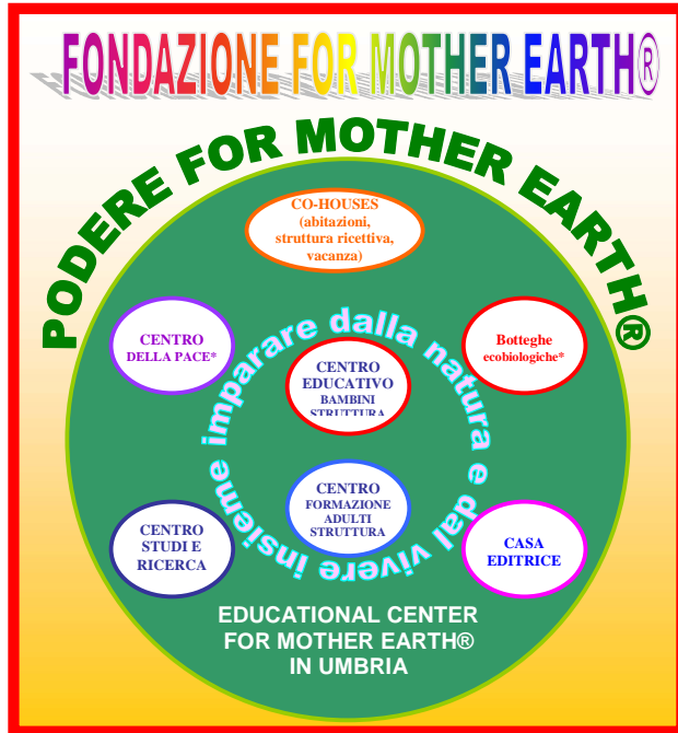
Mappa 1 - IL SOGNO FOR MOTHER EARTH®

CONTATTI: Email: lopresti@intelligenzaemotiva.it - tel 075/800.19.06 - cell. 3200/49.52.95 - quaternucci@intelligenzaemotiva.it - tel 051/54.81.54 - cell 347/4401759