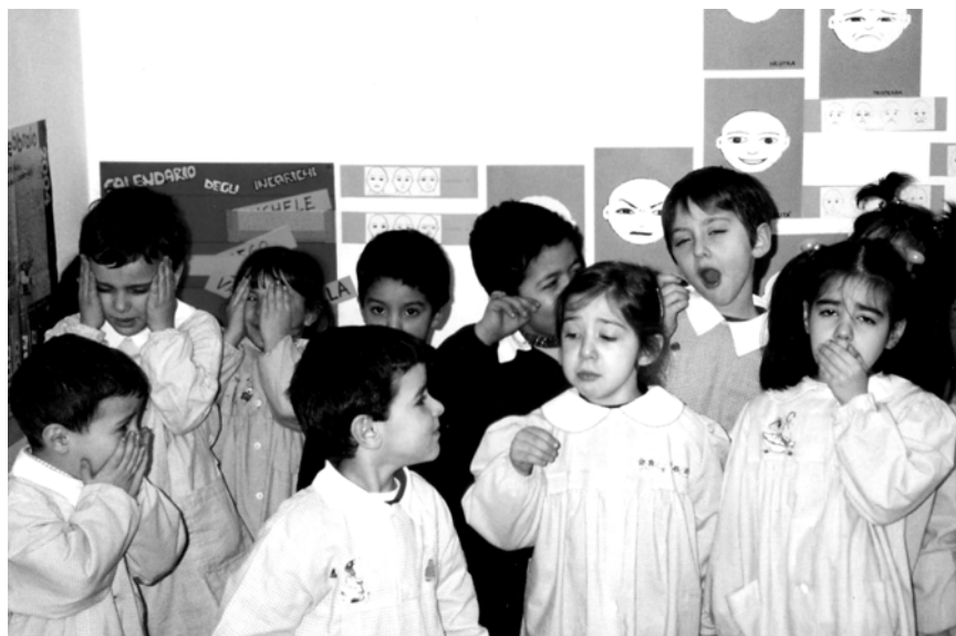
La tristezza nelle sue diverse gradazioni – Allenamento Emotivo nella pluriclasse della Scuola dell’Infanzia di Bettona Capoluogo – a.s. 2003/2004