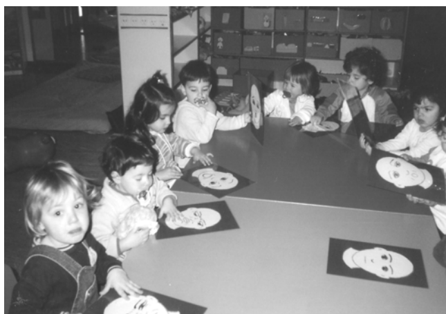
Allenamento Emotivo nel Nido Comunale di Bettona a.s. 2003/2004