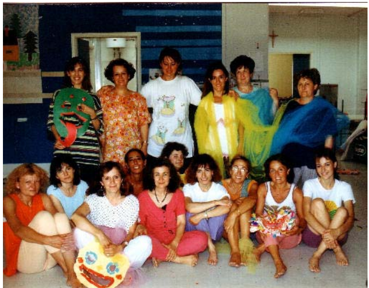
Foto di gruppo con la docente, al centro